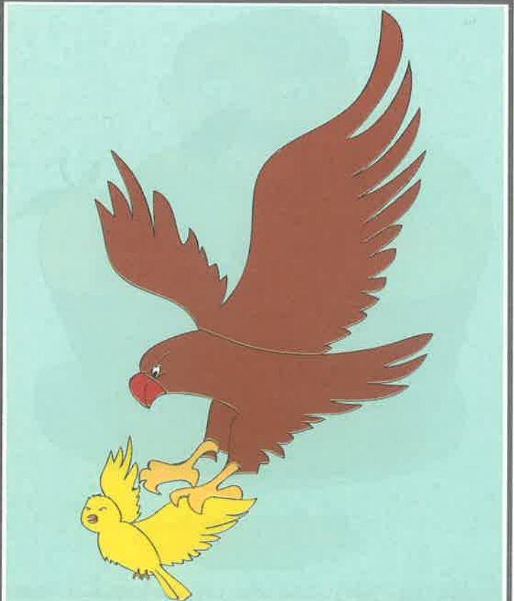
عقاب بزرگ، بال بلبل را گرفت