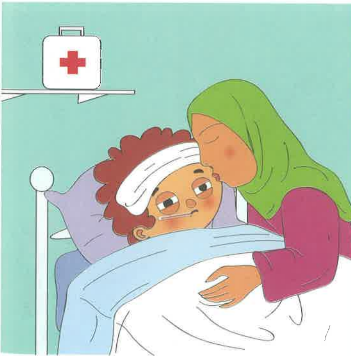
بابک بیمار است و تب دارد. او در بیمارستان بستری است مادر بابک را می بوسد. بابک بیدار و بسیار بدحال است