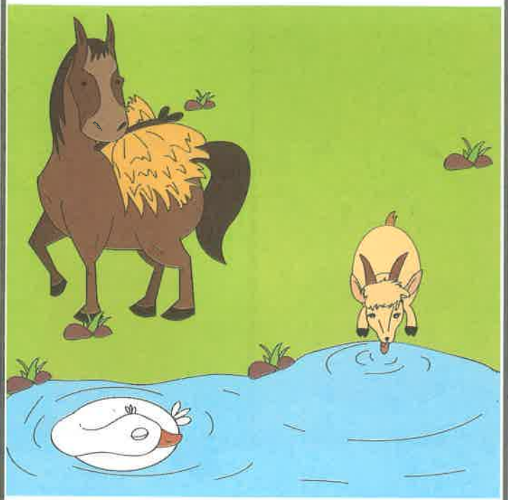
اسب بارکش بار می برد. مرغابی خواب است. بز آب می خورد