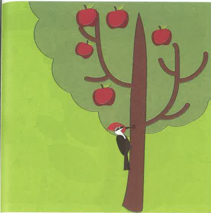
دارکوب با نوک به چوب درخت می کوبد. سیب روی درخت است