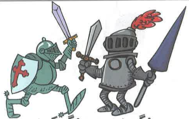
جنگیدن - جنگ کردن