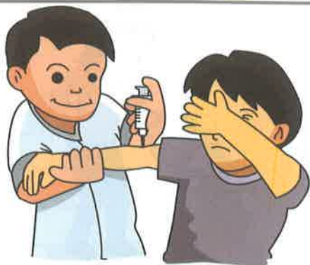
آمپول زدن - تزریق کردن