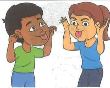
ادا درآوردن - شلک درآوردن