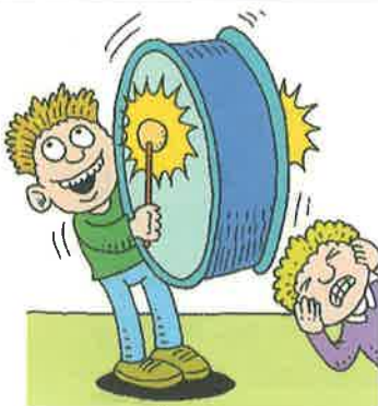
سر و صدا کردن